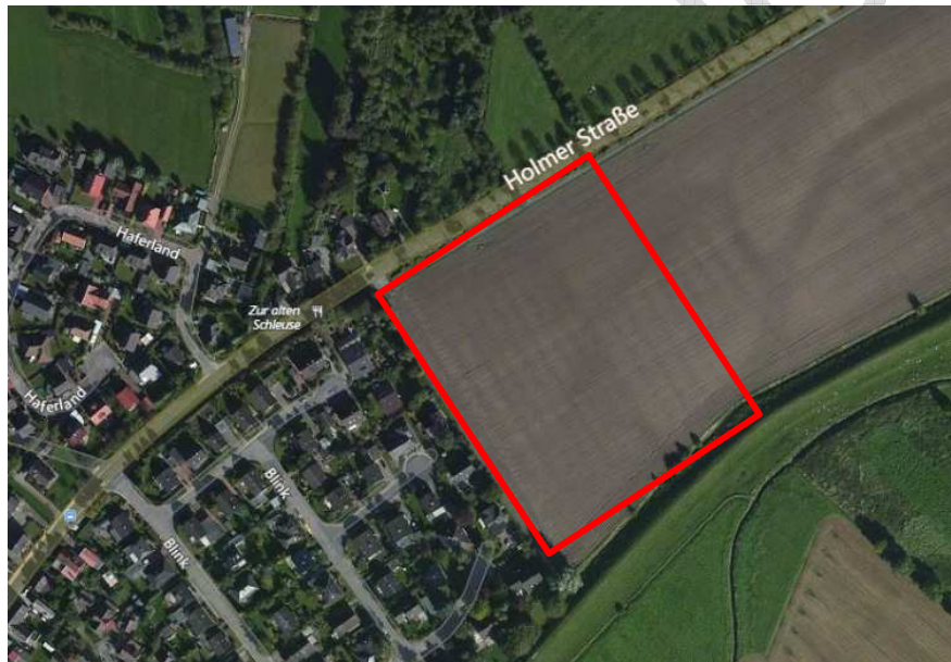
Abbildung 1: Plangebiet (Bing Maps, 2017 Microsoft Corporation)

Die Holmer Straße führt in Richtung Norden zur B 431 in der Gemeinde Holm. In Richtung Süden führt die L 261 in Richtung Haseldorf.